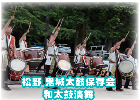
松野 鬼城太鼓保存会 和太鼓演舞