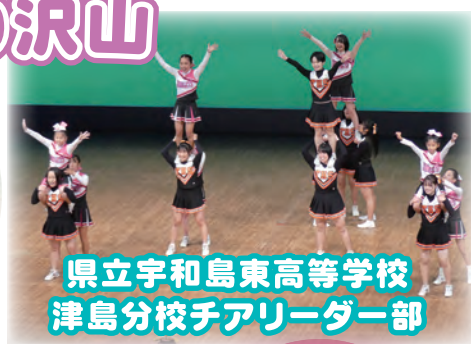
県立宇和島東高等学校 津島分校チアリーダー部